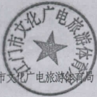
市文化广电旅游体育局