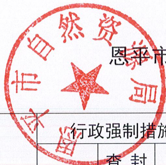
恩平市自然资源局 2024 年度行政强制实施情况统计表