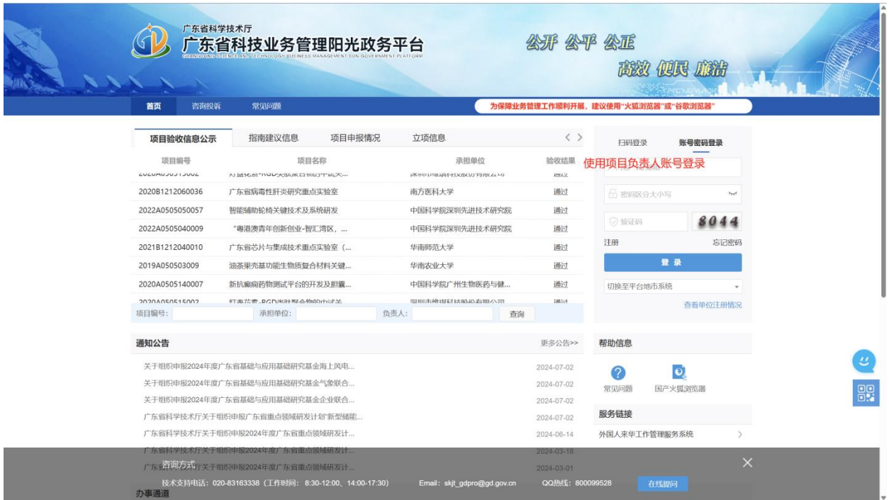
图2 广东省科技业务管理阳光政务平台系统登录界面

用项目负责人账号登录系统，“申报管理”-->“填写申请书”-->“新增项目申请”，选择“区域创新能力与支撑保障体系建设”>“工程中心认定”，填写申报信息。