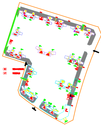
地块2楼栋区位示意图